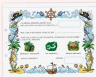
Lámina de plástica, dinámica emocional, actividad colectiva, juego cooperativo, ambientación y organización del aula.

¡Completa y amplía de manera lúdica el trabajo del proyecto!