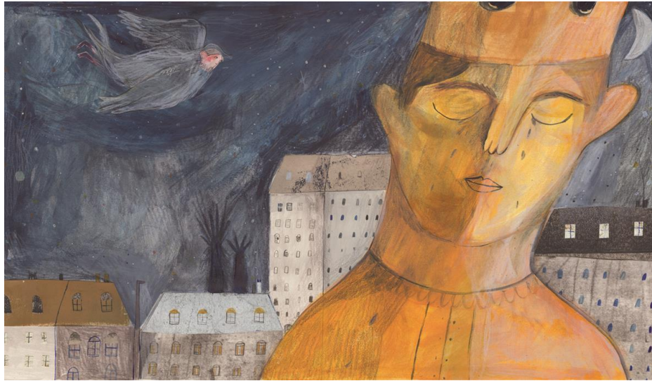
El príncipe Feliz, SM, 2016

Este álbum es una adaptación del cuento infantil de Oscar Wilde El Príncipe Feliz . La ilustradora muestra un gran dominio de la construcción de personajes y escenas de grupo en una composición narrativa donde cada imagen constituye un fragmento de la historia. Asimismo, revela una gran capacidad para encuadrar las escenas; y alterna con maestría primeros planos y panorámicas, y páginas con ilustraciones secuenciadas en viñetas.