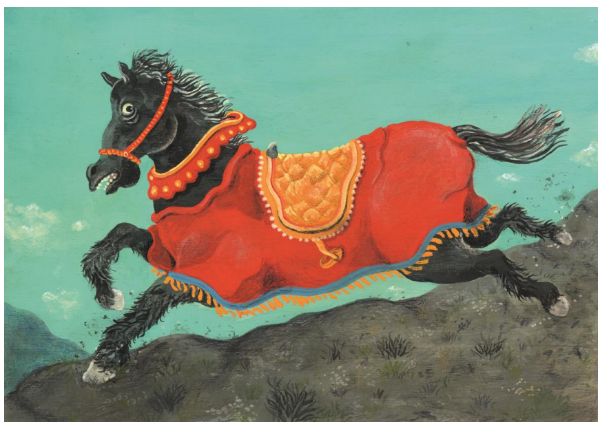
La leyenda de don Fermín, SM, 2018