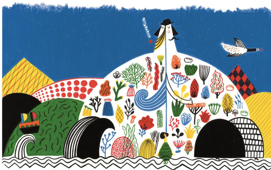
La sirena y los gigantes enamorados, SM, 2015

Catarina Sobral (Coimbra, 1985) se graduó en Diseño en la Universidad de Aveiro y realizó un máster en Ilustración en la Universidad de Évora. Fue seleccionada para la Exposición Internacional de Ilustradores de la Feria de Bolonia en 2012 y 2014. Vive en Lisboa, donde trabaja como ilustradora independiente para periódicos y revistas portuguesas, y publica libros infantiles.