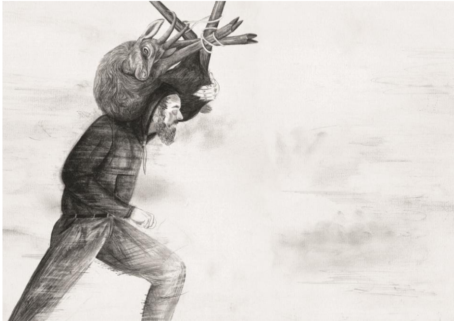
¿Quién es Guillermo Tell?, SM, 2013

"Un hombre libre y un asesino. Un inconsciente y un loco. Una insurrección y una amenaza. ¿Quién es el tirador, que da en una manzana sobre la cabeza de su hijo?" Ilustraciones elegantes en la ejecución y en sintonía con el lado más oscuro del alma humana.