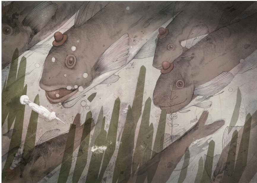
El soldado de plomo, SM, 2012

Page Tsou (Taiwán, 1978) estudió Bellas Artes en la Universidad Nacional Chiayi de Taiwán, realizó un máster en Diseño Gráfico por la Universidad de Kingston, y uno de Comunicación, Arte y Diseño en el Royal College of Art de Londres. Ha expuesto en varias ocasiones en la Feria Internacional del Libro Infantil y Juvenil de Bolonia. Realiza proyectos artísticos propios y trabaja como diseñador para publicaciones y marcas.