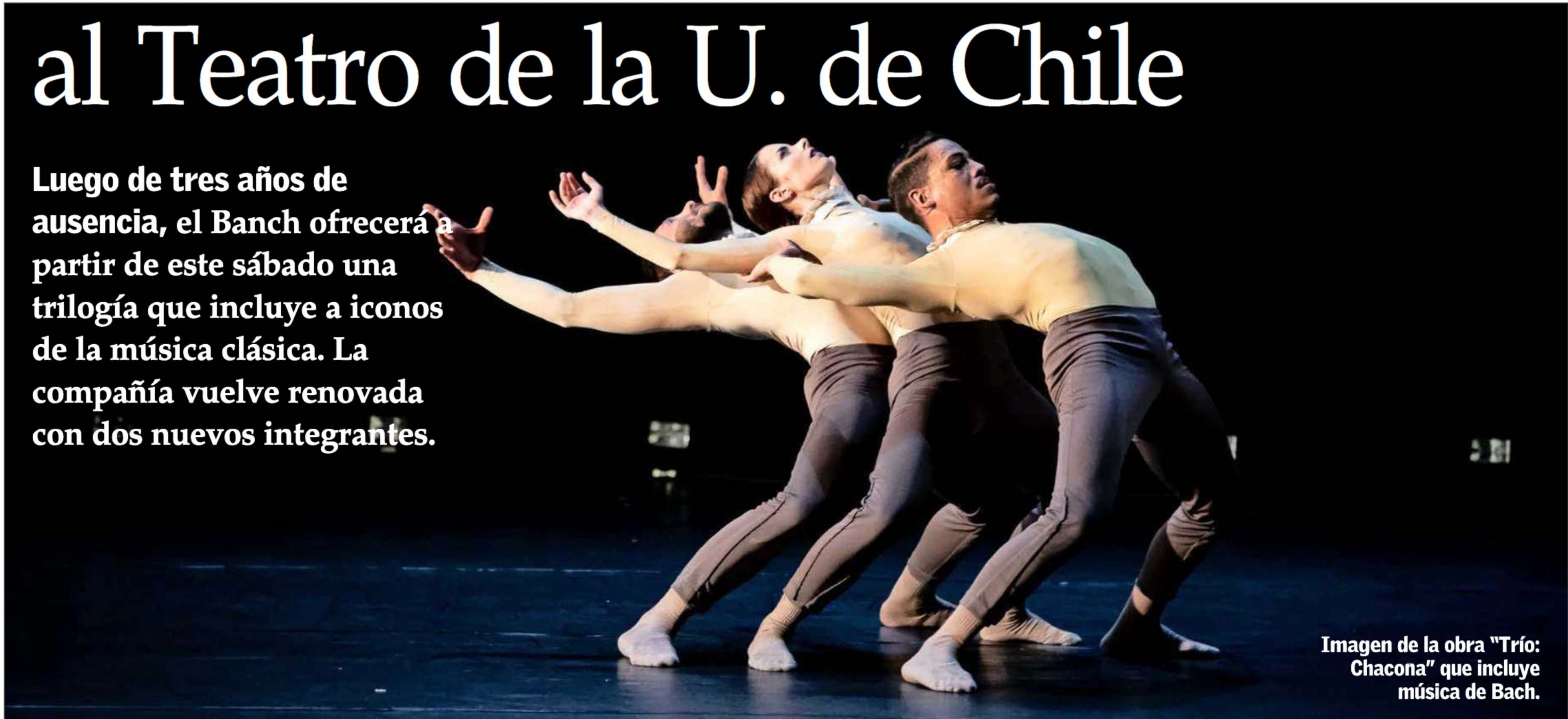
Imagen de la obra "Trío: Chacona" que incluye música de Bach.

Luego de tres años de ausencia, el Banch ofrecerá a partir de este sábado una trilogía que incluye a iconos de la música clásica. La compañía vuelve renovada con dos nuevos integrantes.